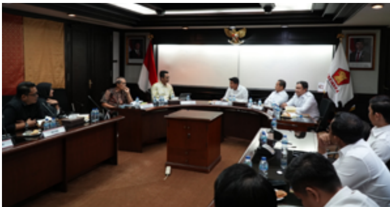
Audiensi Koalisi ke DPP Partai Gerindra, Senin (20/04)

Melalui rangkaian audiensi ini, Koalisi Masyarakat Sipil berharap pembahasan revisi UU Pemilu dapat segera dilakukan secara lebih terbuka, partisipatif, dan substantif. Karena keterlibatan partai politik dinilai menjadi aspek penting dalam mendorong reformasi pemilu yang tidak hanya menjawab kebutuhan teknis penyelenggaraan, tetapi juga memperkuat kualitas demokrasi dan representasi politik di Indonesia. ●